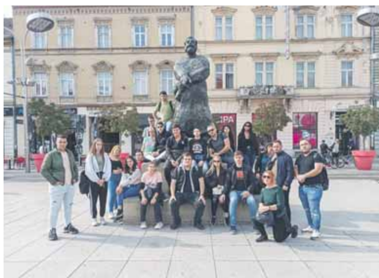
Rengeteg élménnyel ajándékozta meg a csapat tagjait a horvátországi utazás