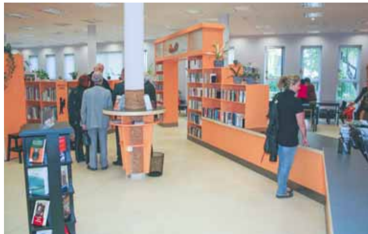
Tervezik a RaM-ban működő könyvtár látogatását is

tart előadást a bél és az agy kapcsolatáról a MEDI klub szervezésében. A novemberi programok sorát 21-én egy órai