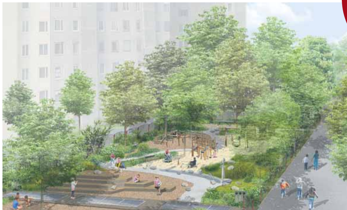
A nagyok játszóterének látványterve

Hamarosan elkezdődhet a Gyöngyösi sétány ökojátsszóterének kialakítása, a képviselő-testület még októberi ülésén elfogadta a beruházás célokmányát. A fejlesztés mintegy 327,7 millió forintba kerül, az összeget a kerület 2022-es költségvetése tartalmazza. Az önkormányzat a városrész hosszú távú fejlesztési stratégiájában megfogalmazott szempontok mentén, a közterületek integrált fejlesztési programját tartalmazó AngyalZÖLD 3.0 Stratégia alapján végzi tervezett munkáit. E program egyik prioritása a klímavédelem, a klímaváltozás hatásaihoz való alkalmazkodás, az ökológikus zöldfelületi gazdálkodás.