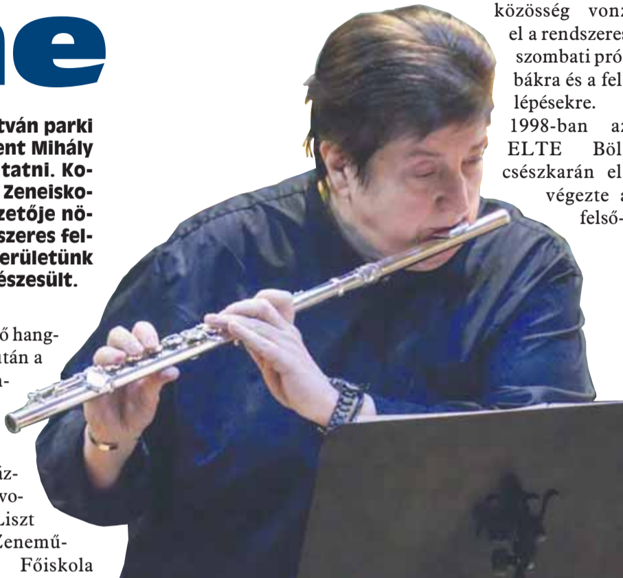
Partneri viszonyban van növendékeivel