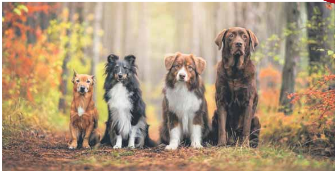
A legszelídebbnek tartott kutya is megkergetheti az erdei állatokat

Ne feledjük: a felelős állattartó elsősorban saját kutyája, a város körül megmaradt természeti környezet és kiránduló embertársai védelme miatt tartja be az erdei kutyasétáltatás írott és íratlan szabályait.