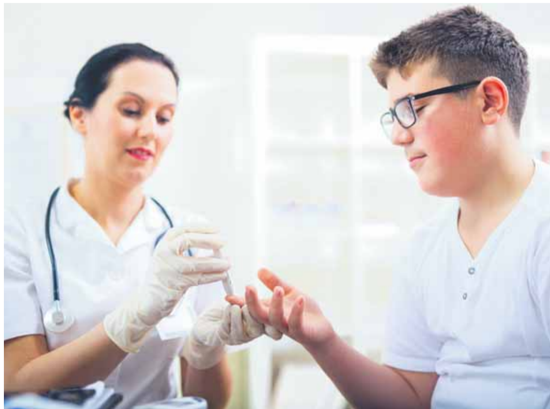
Van esély a már meglevő szövődmény visszafordítására

A baj késői felfedezésében része van annak is, hogy a cukorbetegség jó néhány tünete nem csupán erre a kórra jellemző. A hirtelen fogyás, a szájszárazság, gyakori szomjúságérzés,