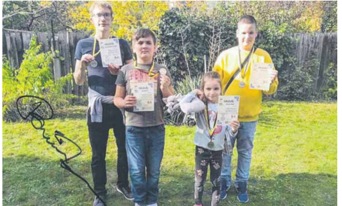
Portisch Lajos nemzetközi nagygyemester dedikálta a fényképeket a gyerekek részére

A gyerekek fotói az AJAMK-ban egy hónapig láthatóak lesznek. Mindemellett