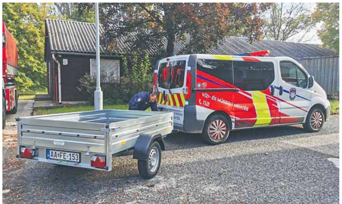
A napi munkát könnyítik meg az új gumibroncsok

Októberben még egy eszközzel gyarapodott polgárőreink gépjárműparkja. A Budapesti Mentőszervezet rendelkezésükre bocsátotta a Trailer Europe Alfa típusú utánfutót. A mentősök a két szervezet együttműködésének idejére biztosítják a feladatok elvégzéséhez, illetve a felszerelések szállításához szükséges járművet.